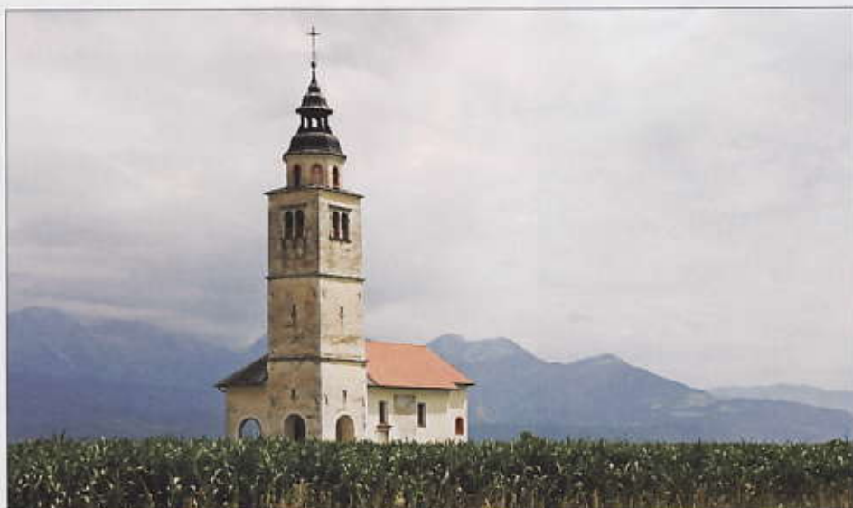
Kranj est une ville historique tout à fait pittoresque située sur une saillie rocheuse, entre les rivières de montagne Sava et Kokra.