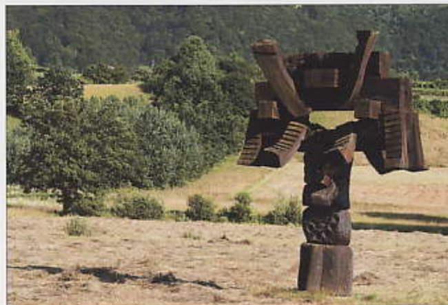
Une sculpture de l'exposition en plein air « Forma Viva », dans le parc attendant au monastère cistercien de Kostanjevica.