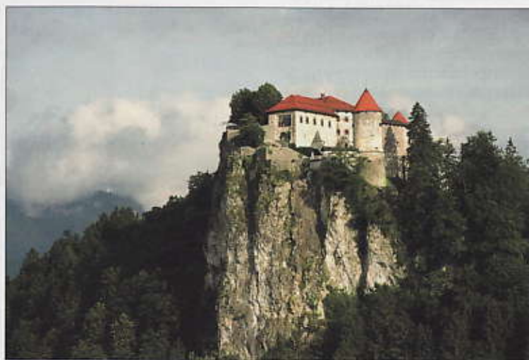
Le château de Bled, juché sur un éperon rocheux en surplomb d'un lac un tantinet féerique... Un vrai paysage idyllique.