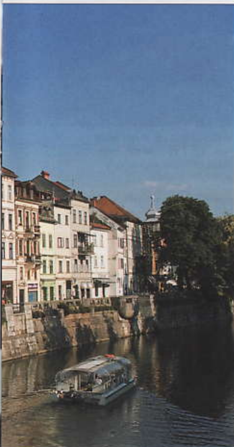
De paisibles promenades fluviales sont possibles à Ljubljana, sur le Ljubljanica qui traverse la capitale slovène.