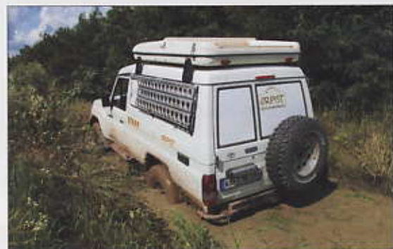
Un véhicule d'Orpist' en pleine action sur l'un de ses terrains de dilection !