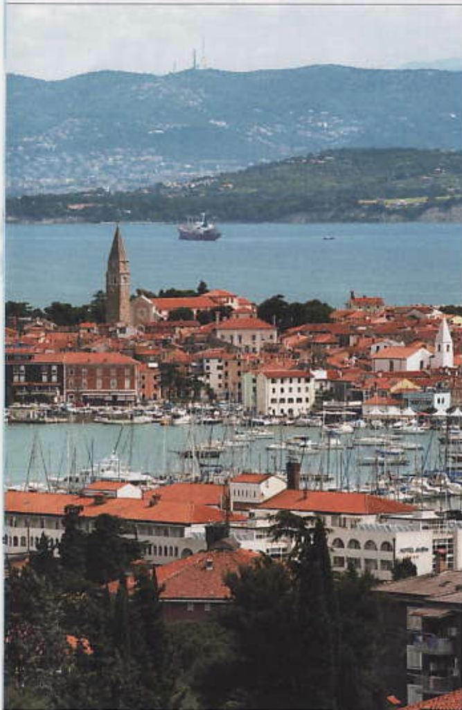
Izola, près de Piran, l'une des plus belles cités médiévales de Slovénie, construite sur le splendide littoral de la côte Adriatique.