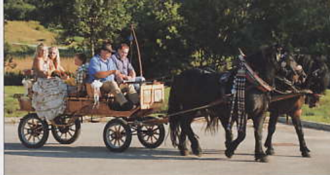
Au pays des chevaux Lipizzans, que l'on retrouve à la célèbre l'École espagnole d'équitation de Vienne, les balades en calèche sont toujours très appréciées.