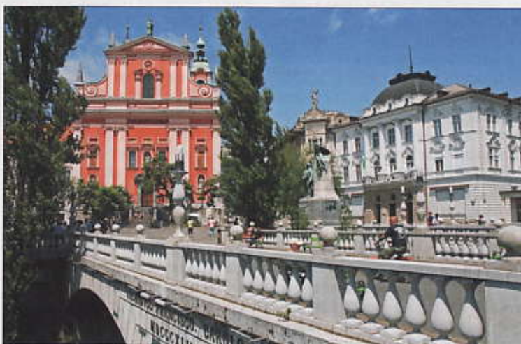
Tromostovje ou les Trois Ponts, la curiosité architecturale de Ljubljana, œuvre de l'architecte Jože Plečnik dont l'achèvement remonte à 1931.