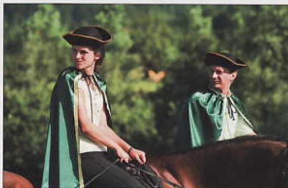
Une cérémonie en tenue traditionnelle qui souligne l'importance de l'art équestre en Slovénie.