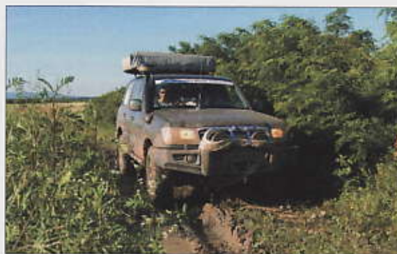
Un exemple très explicite du potentiel d'excursions tout-chemin sur le territoire slovène avec Orpist'.